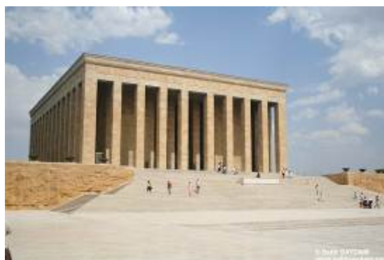
Mavzolej Atatürka, Ankara

letošnje kemijske olimpijade še v posebno čast in veselje, saj je potekala v času Mednarodnega leta kemije 2011, o katerem smo pisali v 2. številki e-novic. Več o letošnji olimpijadi si lahko preberete na uradni spletni strani http://icho43.metu.edu.tr/ . Naslednje leto bo 44. mednarodna kemijska olimpijada od 21. do 30. julija potekala v Washingtonu DC v Združenih državah Amerike. ▀