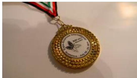
Gregorjeva medalja