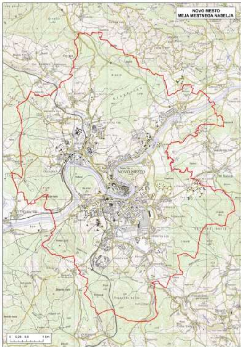
Vir: RC Novo mesto, 2015